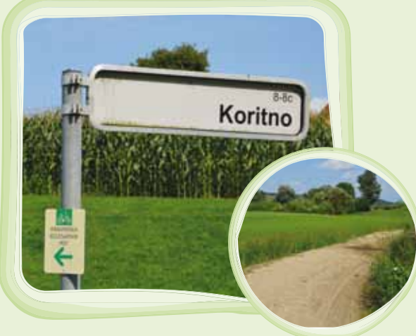
Označitev 3 kolesarskih poti: Dravinjske, Formilske in Poligonske kolesarske poti