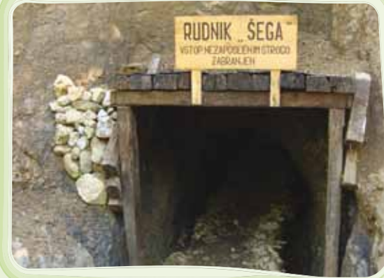
Odkopan rov rudnika Šega – učna točka o premogovništvu