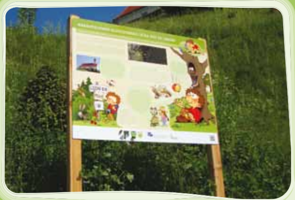
Naravoslovno - zgodovinska učna pot sv. Lenart