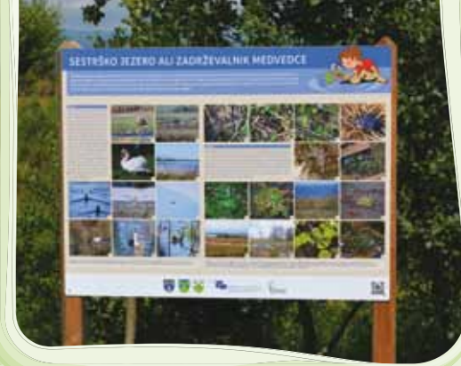
Sestrsko jezero z bogatim živalskim in rastlinskim svetom