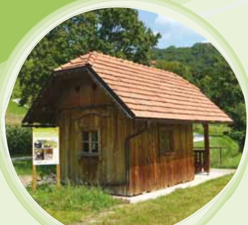
Vaški mlin v Narapljah kot učna točka z Orientacijsko učno potjo.