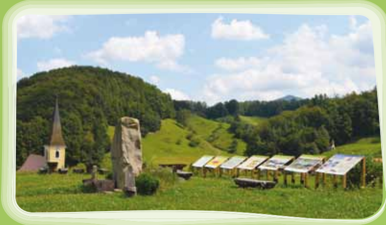
Geografska učna pot Stoperce z atrijsko postavitvijo učnih tabel