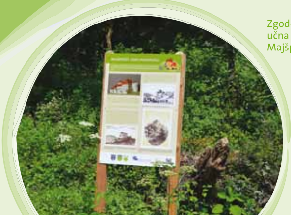
Zgodovinska učna točka Majšperški grad